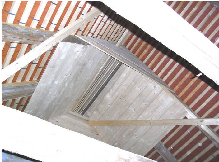
Spaltenquartier in einer Wärmeglocke