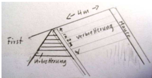
Skizze einer Wärmeglocke

Skizze für ein neues Spaltenversteck im First. Die Verstecke sollen zwischen zwei Sparren angebracht und seitlich geschlossen werden. Es ist sägeraues Holz zu verwenden. Um Zugluft zu vermeiden, dürfen keine Lücken zwischen den Brettern bestehen.